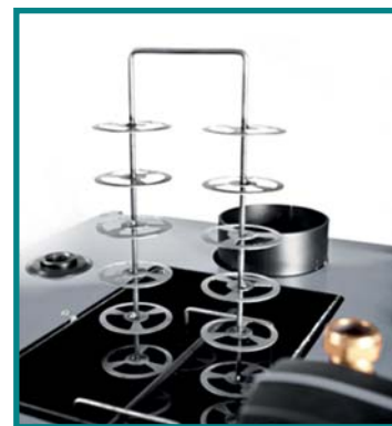
Automatyczne czyszczenie wymiennika kotła

W połączeniu z dedykowanym podajnikiem i zasobnikiem peletu (PP10 + ZP200) otrzymujemy idealnie dopasowany zestaw, który jest w stanie zapewnić komfort ciepły oraz przygotowanie ciepłej wody użytkowej.